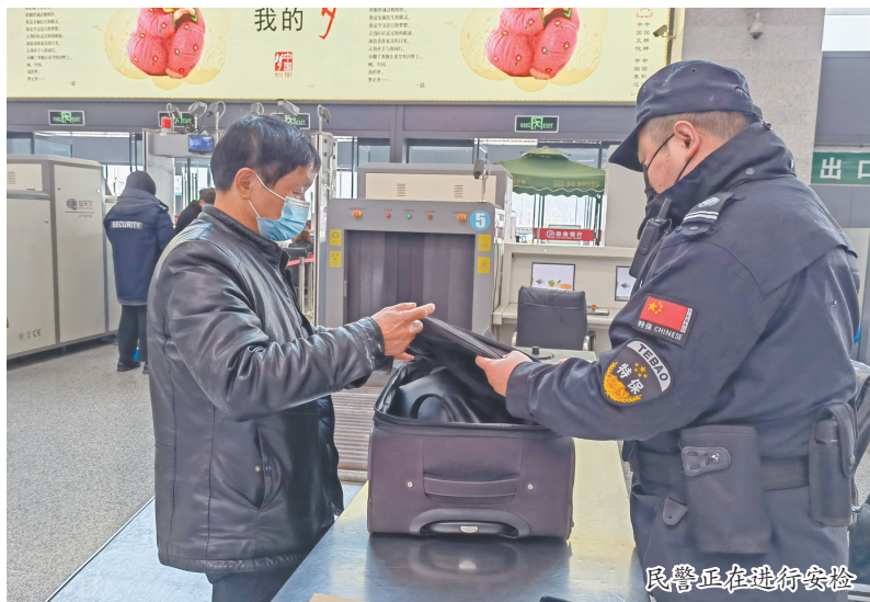
民警正在进行安检

铁路作为春运的主力军,火车站的安全秩序状况牵动社会的神经。1月18日,春运第二日,记者来到芜湖火车站走访发现,作为火车站内治安工作的维护者,合肥铁路公安处芜湖站派出所已投入到春运安全秩序维护与相关服务工作中。除了站内治安工作外,他们还要开展违禁品检查工作,相关服务工作自然也不少了。