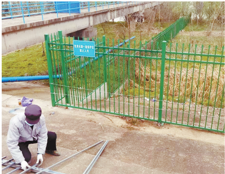
镜湖区生态环境分局派人修复被破坏的隔离围栏

本报讯 日前,镜湖区生态环境分局巡查人员在对芜湖市杨家门水厂饮用水水源一、二级保护区进行巡查时,发现一级保护区陆域部分隔离围栏被人为破坏,里面竟有6人在偷挖野菜,巡查人员立即对他们的违规行为给予告诫并劝离。