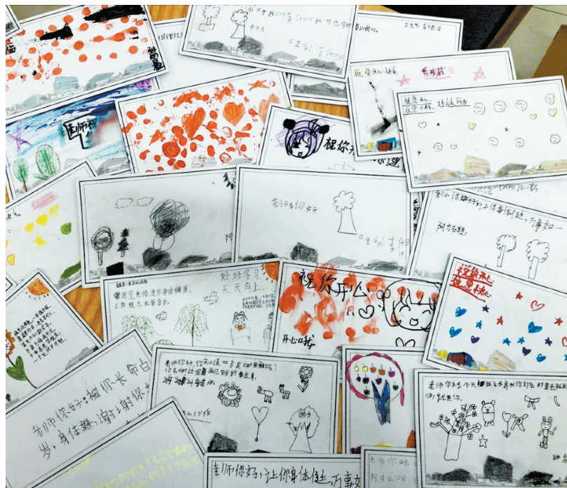
孩子们用手绘贺卡的方式表达对芜湖老师的感谢