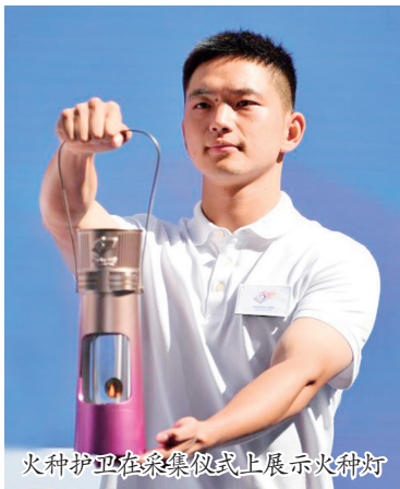
火种护卫在采集仪式上展示火种灯

新华社广州10月12日电 杭州第四届亚洲残疾人运动会火种12日在首届亚残运会的举办地广州完成采集。