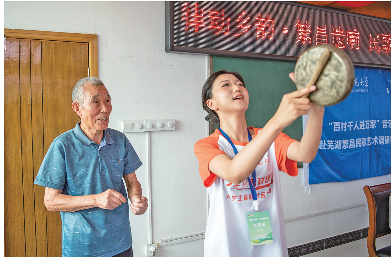
大学生在民间老艺人的指导下体验非遗“十样锦”