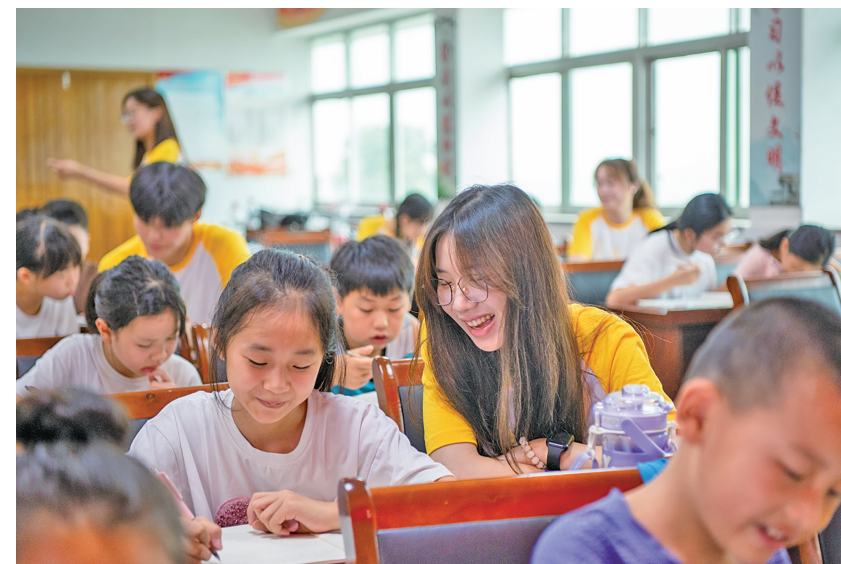
大学生走进乡村 落实暑期“陪伴计划”