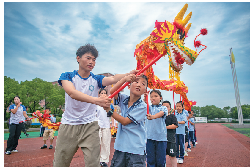
大学生带着当地学生开展篮球、足球和舞龙等体育运动