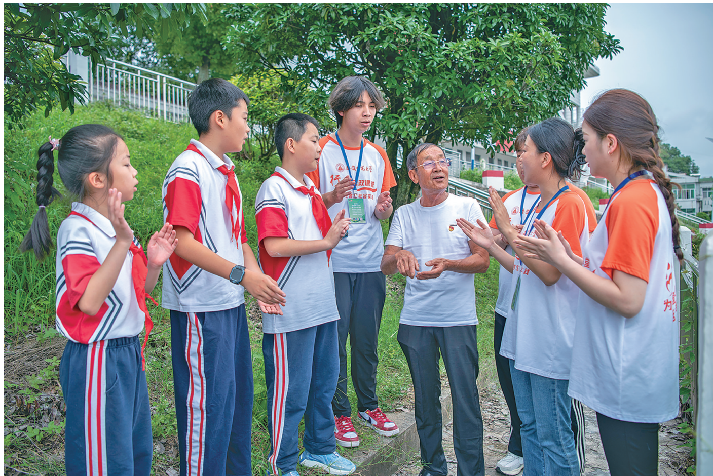
大学生暑期“三下乡”传承非遗文化