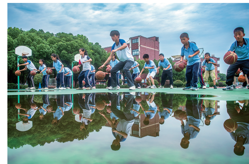
大学生在平铺镇新林九年制学校教小朋友们练习篮球

今年暑假期间,安徽师范大学社会实践队走进繁昌,开展“三下乡”社会实践活动,在为孩子们提供暑期“陪伴”服务的同时,传承非遗文化,并且围绕丰富多彩的体育运动,让孩子们度过一个活力暑假。