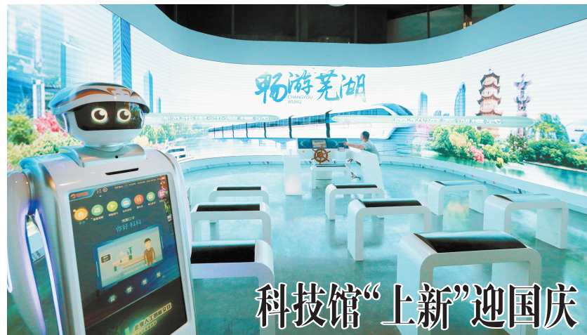
科技馆“上新”迎国庆

生代表均来自一带一路沿线国家。一个小时的“核”文化之行,展教人员向国际友人展示了中国辉煌璀璨的“核”大国成就以及自立自强的民族精神,传递了开放包容、兼收并蓄的价值观,给他们留下了深刻的印象。