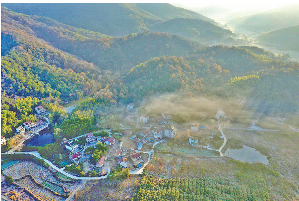
中分村美丽晨光与乡间公路的邂逅