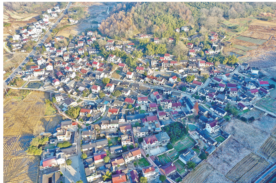
村村相连、路路相通

近年来,繁昌区依托“四好农村路”提质改造美丽公路建设目标,推动景、路融合,探索“美丽公路+”特色经济、特色旅游、慢生活等模式,实现公路建管养与生态环境和谐共生。通过无人机空中俯瞰,展示“村村相连、路路相通”,“交通线”“风景线”“产业线”融合发展,迸发出乡村发展的新动能,从“走得了”迈向“走得更好”,山水蜿蜒间,诗画美景一路同行。