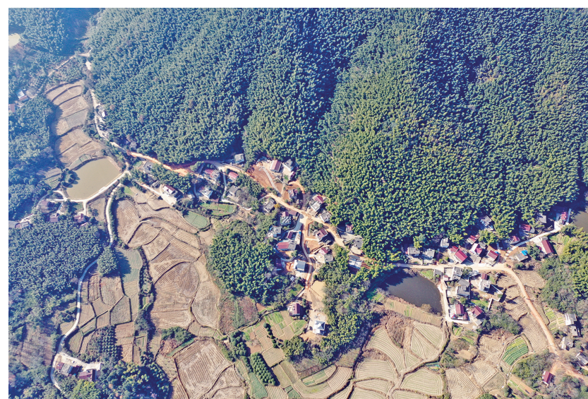
八分村梯田串起诗画风光