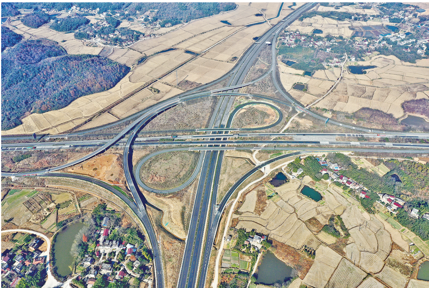
芜黄高速繁昌段互通枢纽