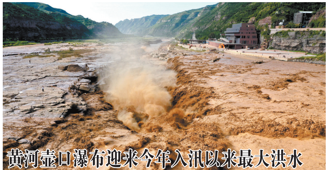
黄河壶口瀑布迎来今年入汛以来最大洪水

8月23日在山西吉县拍摄的洪水过境后的黄河壶口瀑布(无人机照片)。近日,受强降雨天气影响,位于晋陕两省交界的黄河壶口瀑布迎来今年入汛以来最大洪水,每秒流量超过4500立方米。为了确保游客安全,山西吉县壶口瀑布景区于8月22日16时起采取临时关闭措施。