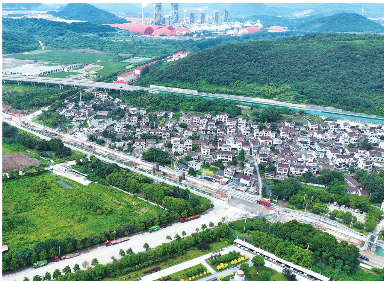
繁昌区构建道路交通新格局,提升路网密度,打通道路障碍,提升道路质量,支撑区域发展。