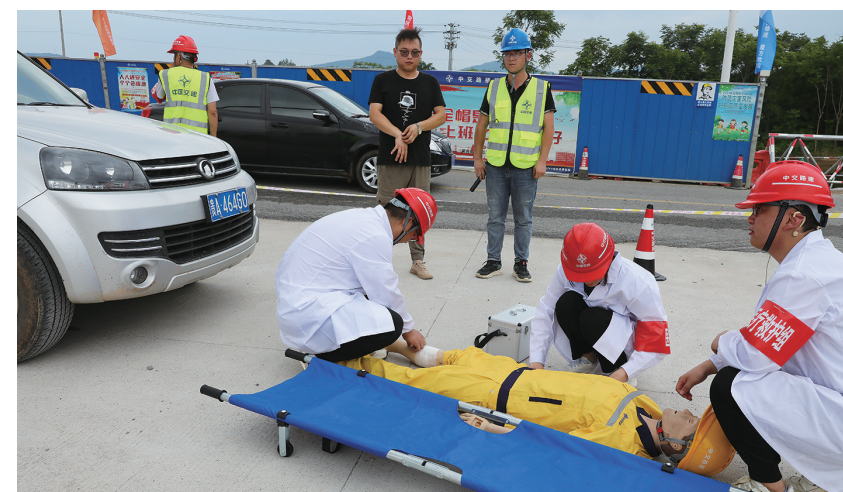
7月7日,繁昌区交通运输局联合平铺镇在S339漳河大桥至湾店段改造工程山河桥施工现场举行车辆伤害应急救援演练。