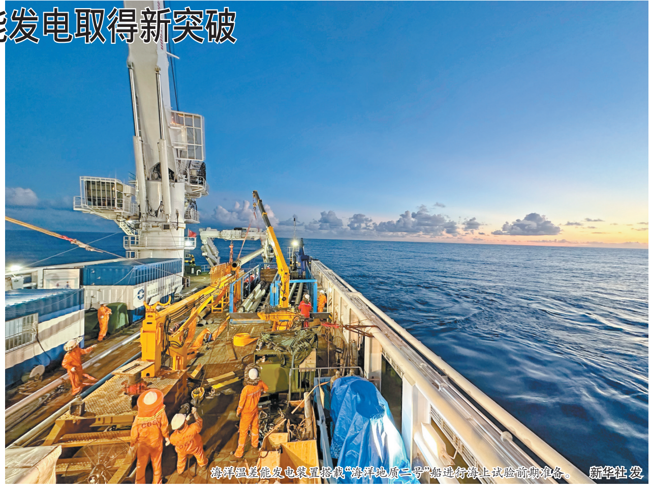
装置搭载“海洋地质二号”船在南海1900米深海海域开展了首次海上试验,成功完成温差能发电技术验证。

晒秋忙 9月11日,山东省临沂市郯城县郯城街道陵坡村村民在晾晒收获的玉米。金秋时节,各地进入收获季,农民抢抓农时收获晾晒,一派丰收的喜人景象。